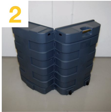
2 Koffer positionieren und ausrichten