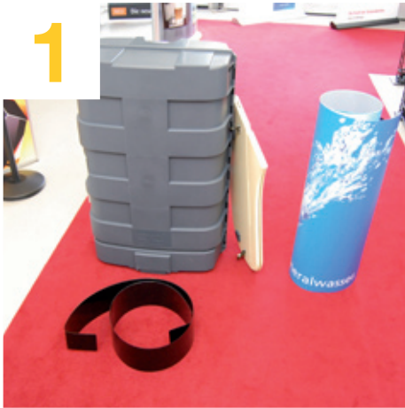
1 Grafik, Deckelplatte und Formflasche aus dem Thekenkoffer entnehmen