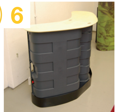
6 und der Seite fixieren