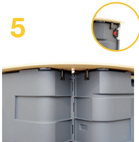
5 und mit den Haken an der Front..