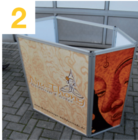
Thekenkorpus an Form des Zwischenbodens anpassen