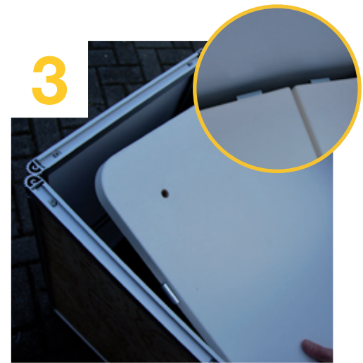
Zwischenboden in Thekenkorpus einlegen, hierbei auf die Haken an der Seite achten