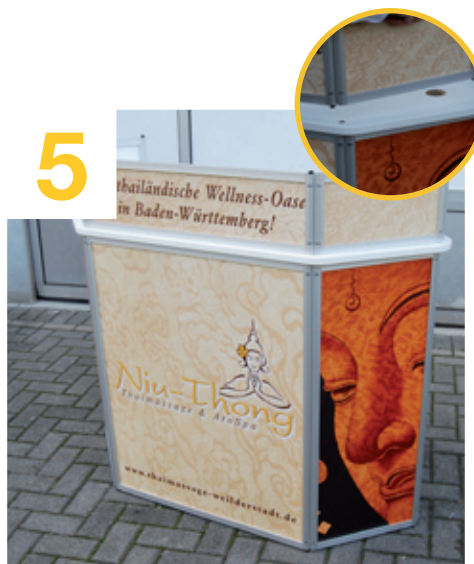
Nasen des Aufsatzes in die Ausfräsungen einpassen