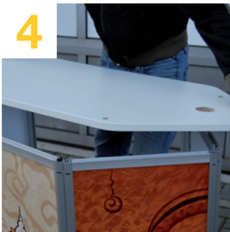
Deckelplatte an Thekenkorpus befestigen und einrasten lassen,