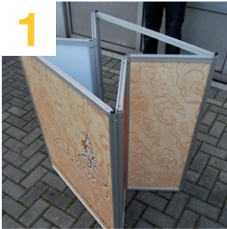
Einzelteile aus der Verpackung entnehmen