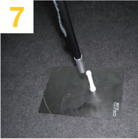
Auf den Fuß stecken