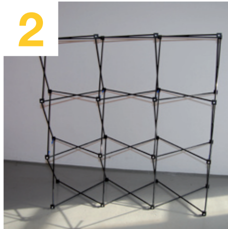
Scherengitter auseinanderziehen und aufstellen