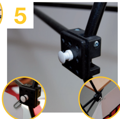
mittels der Gummihaken..