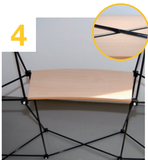
Ablage an der Nut ausrichten und in das System einlegen